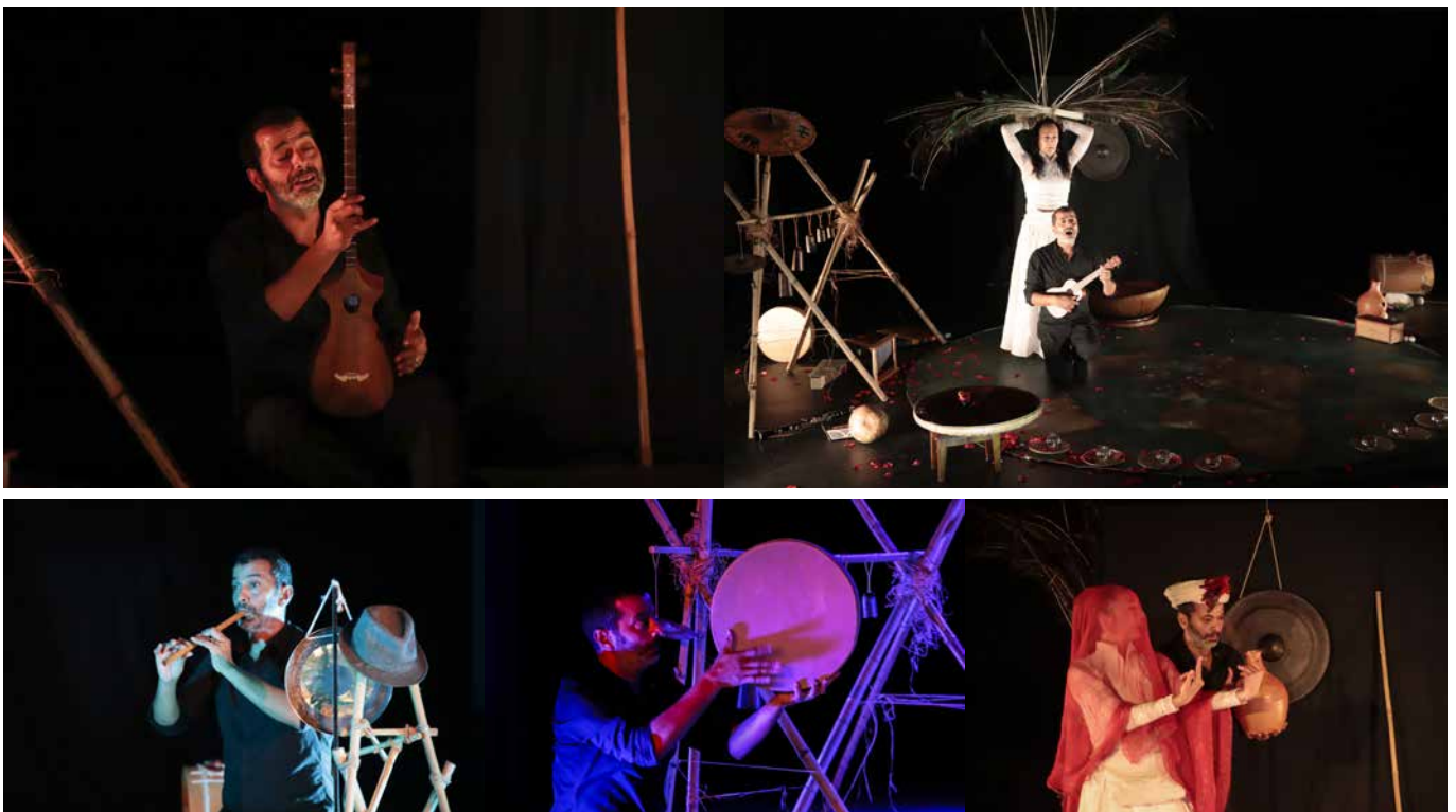
Photos du spectacle