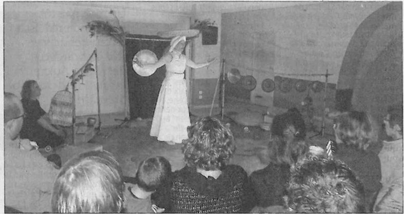
■ Passant d'une culture à l'autre, les artistes ont fait voyager leur public à travers des sonorités et danses venant de tous les continents.

Un spectacle qui reste inscrit au programme de la saison culturelle 2015-2016 et qui est à choisir sans modération.